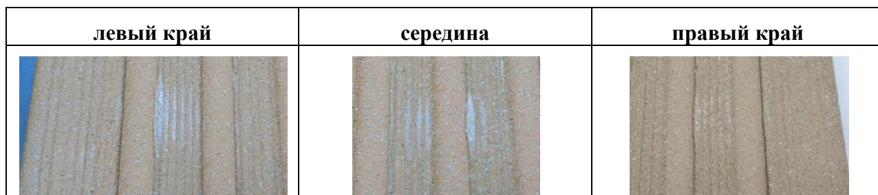
Фото изменения внешнего вида образцов